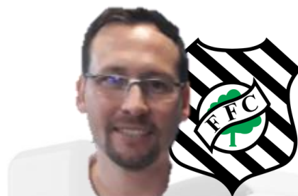
Cristiano Garcez Figueirense Futebol Clube