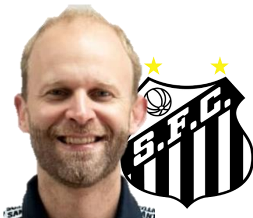
Maickel Bach Padilha Santos Futebol Clube